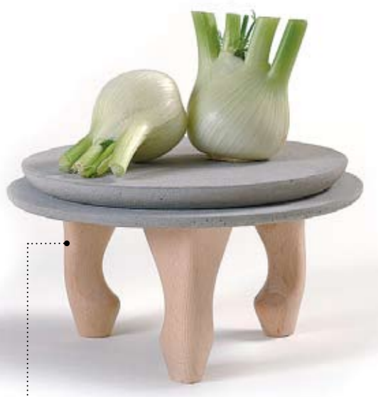
שולחן-מגש. "זה לא באמת מגש ולא באמת שולחן, זאת קטגוריה חדשה שלא קיימת - מעין במה לאוכל"

בית העיצוב קסטיאל מעניק זה שנים רבות במה לאמנים ישראלים, להצגת יצירותיהם ולמכירתן במקום. בימים אלה מושקת חנות חדשה, לקט קסטיאל אביורים, שמציעה מגוון פריטים חדשים ובלעדיים. "עד היום את הרהיטים שלנו עיצבנו בעצמנו, אבל את האביורים שמקשטים את בתי הלקוחות שלנו ליקטנו ממקומות שונים בעולם", אומרת דפנה קסטיאל. "כחברה ישראלית, שמייצרת את מוצריה בארץ, חשבנו שזה לא נכון להתמקד רק במוצרים תוצרת חוץ, והחלטנו לתת במה גם למעצבים ישראלים". שיתוף הפעולה הראשון של החנות נעשה עם המעצב התעשייתי ניר מאירי ("מעבר לזה שהוא נחמד ויש בינינו כימיה, אהבנו מאוד את המוצרים שלו. יש בהם עניין", אומרת קסטיאל). אמנים נוספים המשתתפים פעולה עם בית העיצוב הם יובל שאול - פרטי אמנות, פיליפ בולקה - ציורים, חברת טאלנט (גל גאון) - אמנות, אלכס מייטליס - עיצוב פריטי ריהוט, מוטקיה בלוס - ציורים, גרשוני - ציורים, אילן אדר - תמונות בעיבוד ממוחשב.