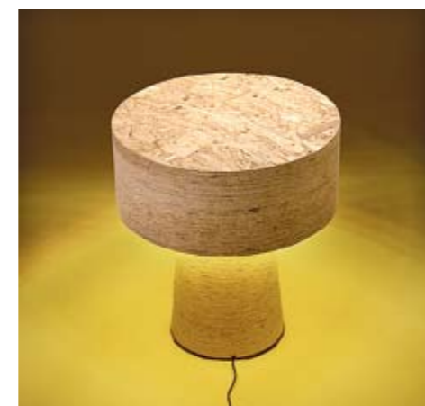
מנורת העץ. מיוצרת ממשטחי סיבית גסים משאריות של עצים

מאירי רואה את המוצר שלו על שולחנות בופה בבתי מלון ואצל חברות הסעדה ו"על שולחנות של אנשים פרטיים עם מודעות גבוהה לאסתטיקה". על צלחת ההגשה ניתן להניח כל דבר שרוצים: סיר חם, פשטידה, עוגה, או סושי. את המגש, שעשוי בולת, ניתן להמם בתנור או במיקרו, לשלוף ולשטוף במדיה. g@globes.co.il