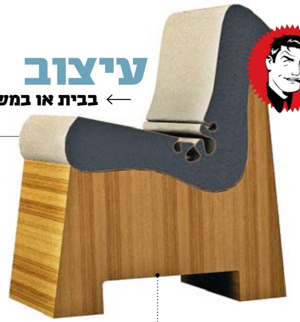
מתוך פרויקט השכבות. חומר רך חודר לחומר קשה

שנדליר. במבט מלמטה נראה כמו פרח זהוב, מורכב מ-19 עציצים חד פעמיים, פשוטים. המנורה הוצגה לראשונה בתערוכת ריהוטים 2009 בביתן "ניאו" לעיצוב מודרני, שבה התבקשו המעצבים ליצור מוצרים שמקורם בפסולת